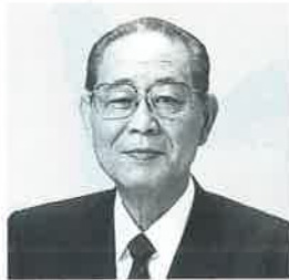
滋賀県知事 稲葉 稔