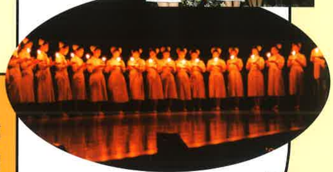
▲キャンドルセレモニー。オレンジ色に揺れる火を見つめれば、感動もひとしお