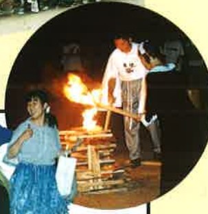
▲ストームに火がともり、キャンプも佳境に...