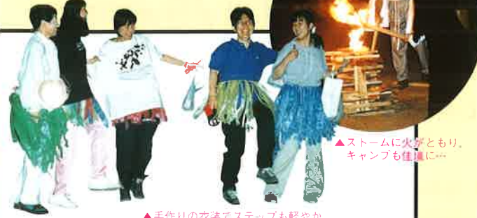
▲手作りの衣装でステップも軽やか