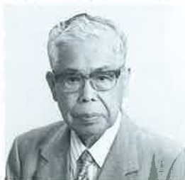
(社) 滋賀県私立病院協会会長 滋賀県堅田看護専門学校校長 滋賀県医療機関厚生年金基金理事長